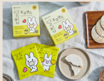
· 유기농 쌀 + 초콜릿 가공품 ·