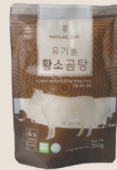
· 유기축산 가공품 ·