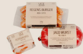
· 무항생제 인증 국내산 냉장 돈육 제품 ·