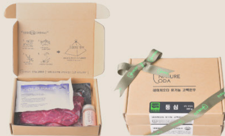
· 유기 축산물 인증, 곡물 배제 풀 중심 발효 사료 한우 ·