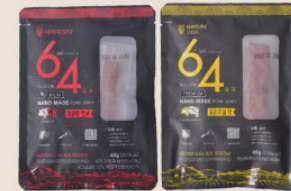
· 무항생제 인증 국내산 냉장 돈육 제품 ·