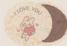
· 이야기를 그린다, 콘텐츠 푸드 ·