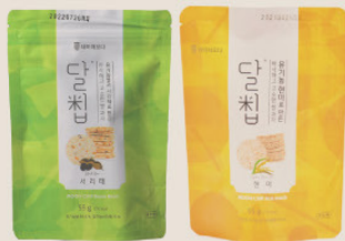
· 유기농 쌀 가공품 ·